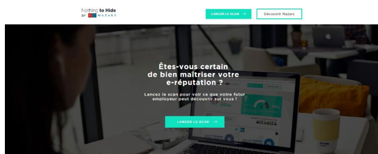
Votre e-reputation en 3 étapes